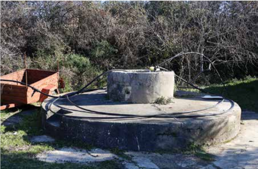
Bunar Ljolja u Crnome