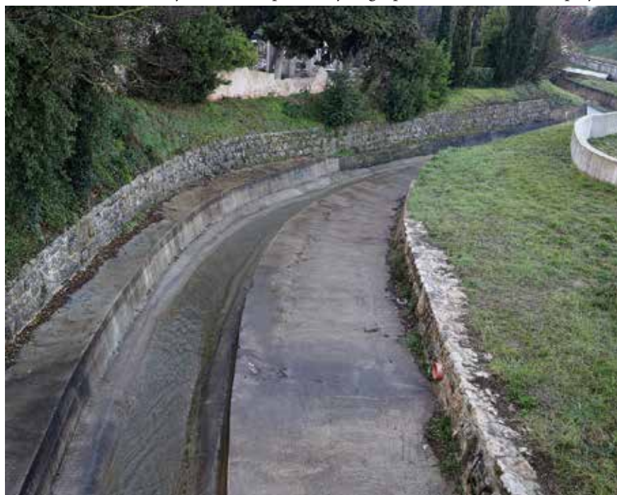
...i spušta se prema moru pored gradskog groblja.