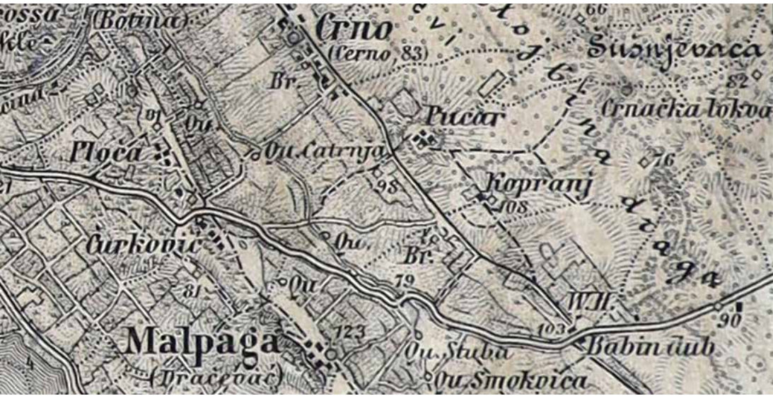
Zemljopisna karta dijela arbanaških polja

Kad se govori o arbanaškim bunarima i o opskrbi Arbanasa vodom, moraju se uzeti u obzir i oni izvori vode vezani uz arbanaška polja koja su hranila Arbanase. Ona su se protezala kroz dolinu između dvaju hrptova brda, od kojih je na sjevernom selo Crno, a na južnom Dračevac i Ploče. Na istoku su počinjala od Babinduba (ili kako ga Arbanasi zovu Dubina, arbanaški në Dubin ) i pružala se prema zapadu do razine tzv. izvidnice (odnosno osmatračnice u slučaju požara) na Bilom brigu na kojem su graničila sa stanarskim poljima. Danas to područje presijeca Magistrala. Nekad su na njemu bila smještena arbanaška polja kojima su se danas i imena gotovo zaboravila. Stoga, da ih se sačuva od zaborava, ovdje ćemo ih navesti. Od Babinduba prema Magistrali bila su to: Pelegrinovo, Vitulovo, Dolci, Akvidot i Škambat (Shkâmbat), Čatrnja te preko Magistrale: Konolet, Vloka (Vllôka) i Mašino.