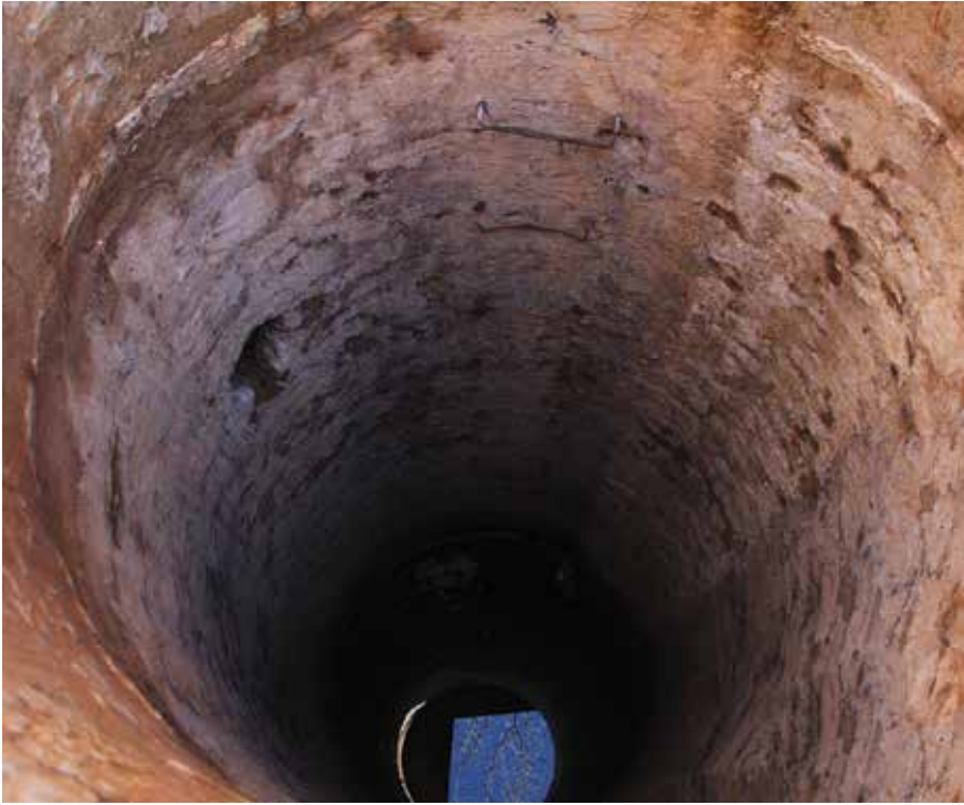
Unutrašnjost Velikog bunara