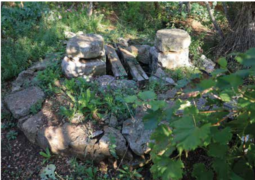
Jedan od starijih bunara u Arbanaškom vrtu