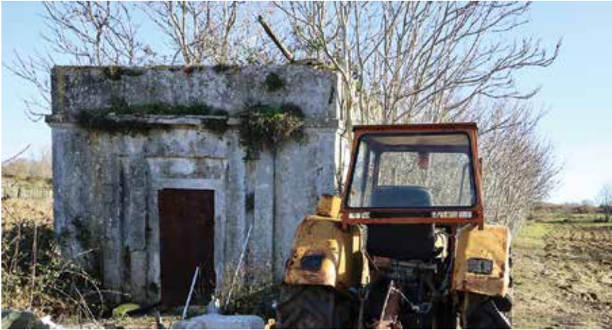
Ostaci vodovodnog objekta Botina ili, kako je Arbanasi nazivaju, akvidot

Osim toga, postojao je i drugi rimski vodovod koji je vodu dopremao u Zadar. Taj je počinjao na području Botine ispod sela Ploča gdje je voda pristizala iz pravca izvora Stubalj preko bunara Četrnje na Pločama (toponimi Ploča i Ričina nekada su se upotrebljavali u množini, zato su ovdje tako navedeni, a i lokalno ih stanovništvo još uvijek upotrebljava u govoru). Na Botini su 1838. godine bila načinjena spremišta odakle su cijevi vodile prema gradu. No do danas je sačuvan samo jedan mali dio tog vodovoda i nalazi se uz postojeći Vatrogasni dom na Bulevaru. Upravo je tridesetih godina XX. stoljeća ta voda iz Botina poslužila kao izvor za prvi vodovod izgrađen u pravcu Arbanasa, tzv. akvidot .