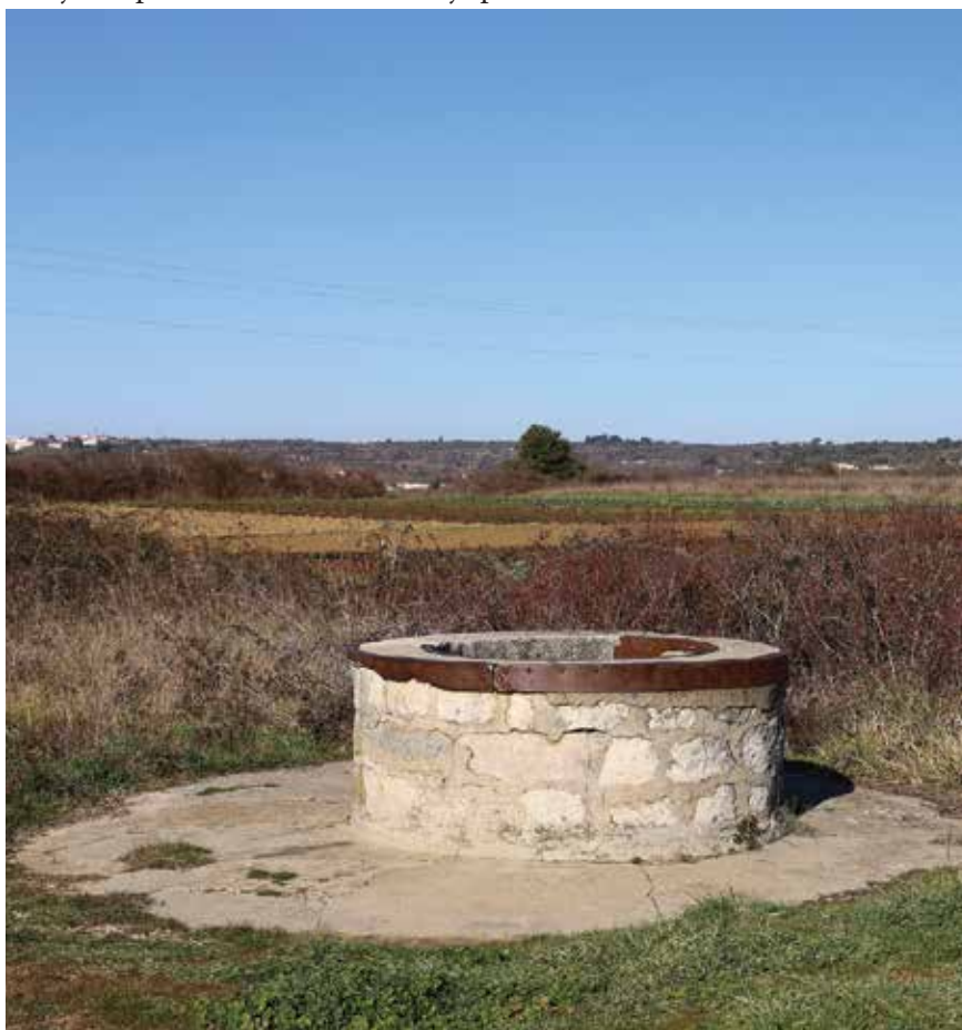
Bunar Čatrnja na Ploči

Naravno, plodnost tih polja ovisila je o količini vode koja bi se utrošila u njihovo zalijevanje. Na svu sreću, cijelo to područje bogato je podzemnim vodama koje su se s istoka iz predjela Babinduba slijevale prema današnjem Krivom mostu pa dalje prema Pločama, a odatle na područje današnje veletrgovine Supernove. Na spomenutim poljima bilo je i nekoliko značajnih bunara s imenima: Ciricini, Kopranj, Matulini, Paprat, Smokvica i Stuba. Glavnom rukavcu tih podzemnih voda putom su se pridruživali mnogi okolni pritoci, tako da je na području Ploča kao središnje sabiralište bio načinjen bunar imenom Čatrnja s toliko snage da je njegova voda preko tzv. akvidota, jednog od starih zadarskih vodovoda, u prošlosti opskrbljivala glavno gradsko vodospremište, Pet bunara. Poslije, u vrijeme talijanskih vlasti, upravo je s tog vodovoda napravljen još jedan ogranak usmjeren prema Arbanasima, i to je prvi arbanaški vodovod.