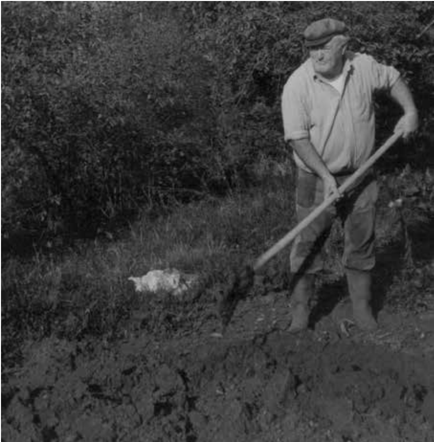
Trebalo je krenuti...

Kopalo se capunima (krampovima), špicama, čekićem, lopatama, a hrabri muškarci spuštali su se duboko u jamu držeći se za konop i vadili zemlju čak i rukama. To je bio najteži fizički posao koji je ponekad završavao tragično, kad bi se stjenke bunara urušile i zatrpale kopača.