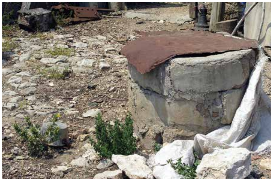
Bunar iza stare kuće Petra Piera Bajla (Krnješa)