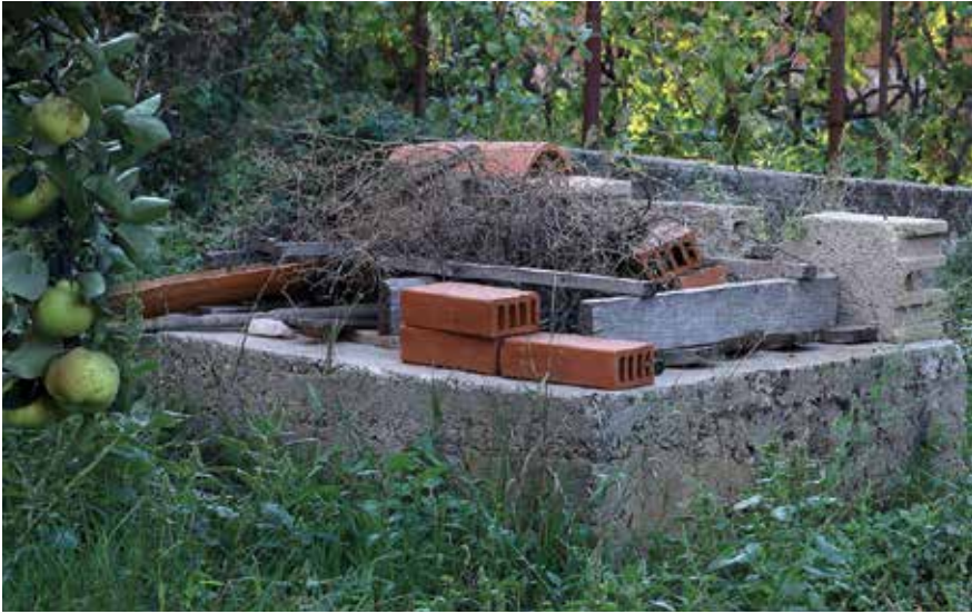
Zapušteni bunar u zapuštenom vrtu Bože Krstića