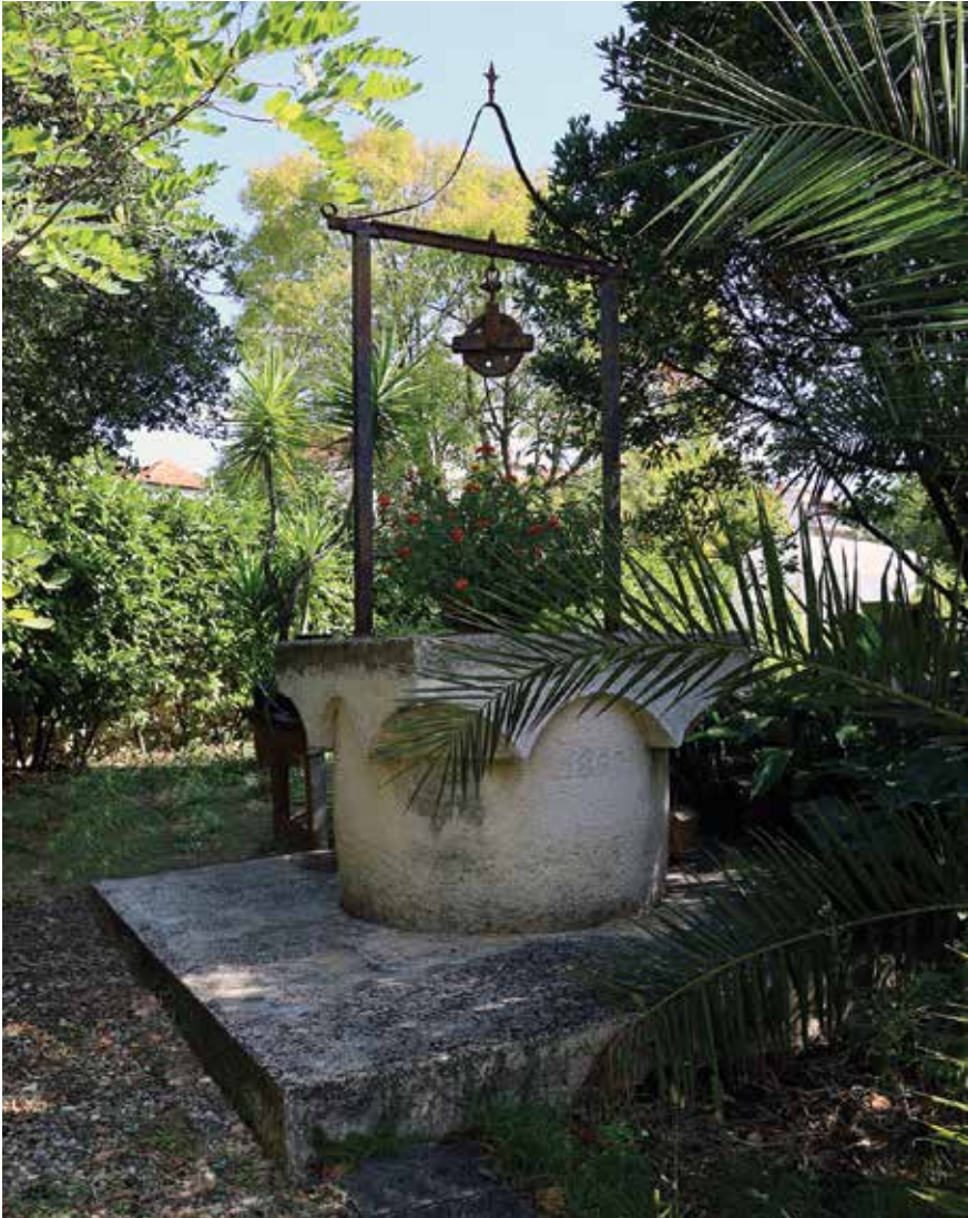
Bunar u dvorištu Marija Kotlara u čijoj je kući nekad davno bila gostionica (arb. Pûsi Oshteria Kotlar )

Tek rijetki su bunari na kojima se to radilo uz pomoć kolotura . Takvih je manje od deset pa ćemo ih navesti: