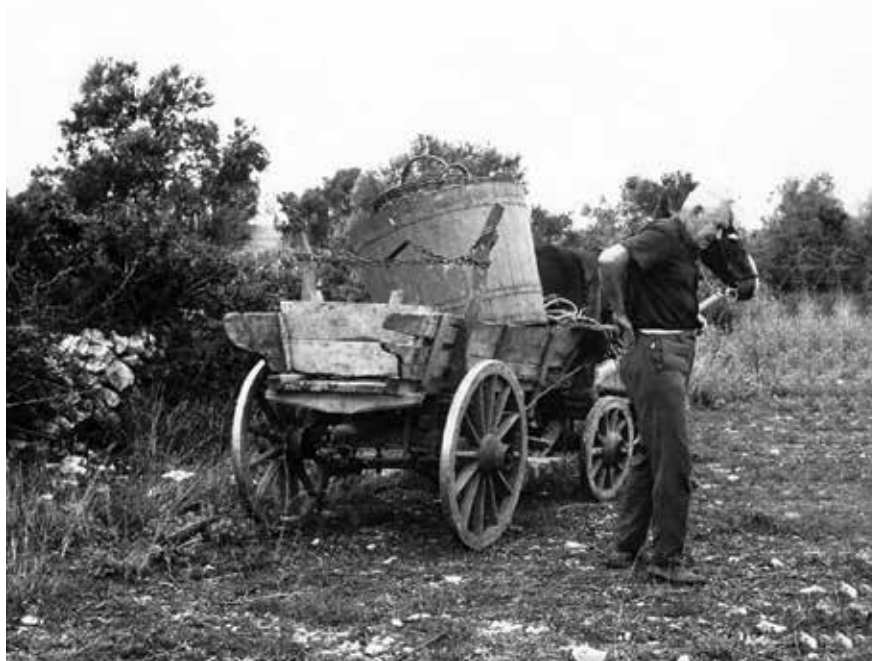
Bez kara i konja se nije moglo

U pravilu se voda dovozila u karovima , i to u drvenim, a poslije i u limenim bačvama. Bačva puna vode pokrila bi se ceradom i svezala konopom kako se voda putom do odredišta ne bi prolijevala zbog treskanja po neravnim cestama. Korak dalje u napretku bile su velike limene bačve koje bi ležeći zauzimale cijeli kar i bile znatno veće nosivosti, od oko dva do tri kubika, punile su se odozgo, a na kanelu (pipak) izlijevala bi se voda u limene siće ili banjadore (polivače) kojima se obavljalo zalijevanje.