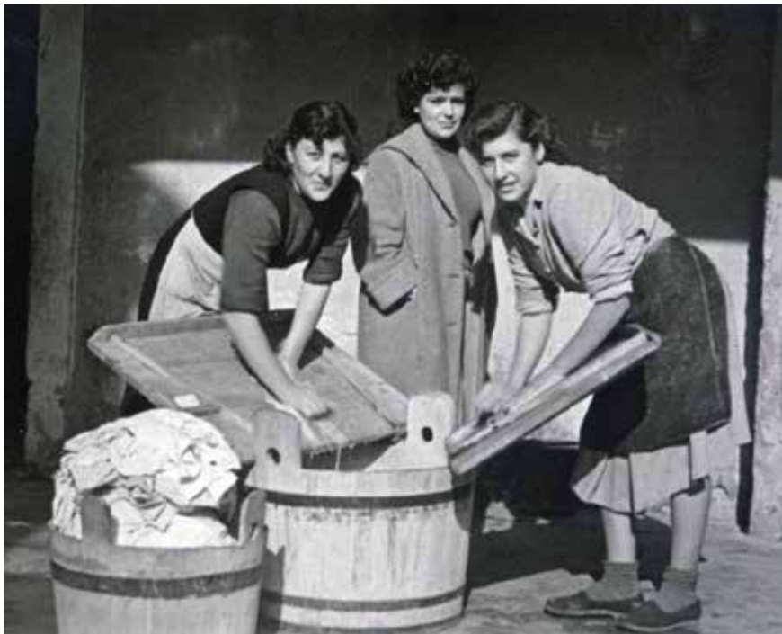
Nakon što bi žene donijele vodu kući, slijedio je teži dio posla – pranje robe.

To su obično radile mlade ženske ruke jer je odlazak po vodu bio jedan od glavnih zadataka seoskih djevojaka . Grabljenje vode iz bunara nije bio baš jednostavan posao, kante su bile teške, ako je bila potrebna još i veća količina vode za pranje rublja ili za napajanje stoke, eto posla na pretek. Ali sve je to imalo i nekih svojih čari, a voda je uvijek bila svježja i hladna, bez obzira na to koliko je vani bilo toplo. Djevojke su u svome mladenačkom zanosu posao spajale s ugodom. Znale su kad je bilo najbolje doći na bunar, kad bi prijateljice bile ondje, da se mogu upoznati s novim čakulama u mjestu: tko se oženio, udao, zaljubio, razišao... Djevojke bi ujutro išle po vodu u skupinama. Pod pazuhom su nosile prazne kablove (arb. e kân mbô kabâin nêr sjêtulla ), a na povratku su pune kablove s vodom nosile na glavi, ali bi prvo stavljale sparu (platneni podmetač). Vrijeme kada su djevojke dolazile po vodu bilo je poznato i momcima, pa bi ih oni čekali kod bunara. Spremno su pomagali svojim izabranicama grabiti vodu i podizati kabao pun vode na glavu, sve uza šalu i udvaranja. Često su znali pratiti djevojku do kuće, ali ne i nositi vodu, jer to je ipak bio ženski posao. No znalo se dogoditi, a to je također spadalo u ritual udvaranja, da mladić namjerno prolje vodu koju je djevojka nosila, tako da je ona bila prisiljena vratiti se na bunar po vodu, naravno uz njegovu pratnju.