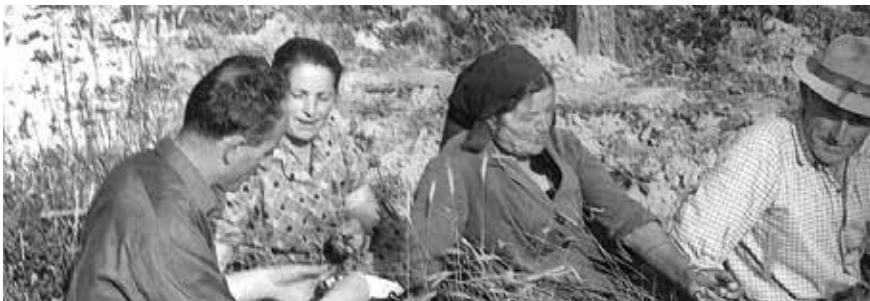
Predah od trganja grožđa u vinogradu

Kad se govori o arbanaškim bunarima i o opskrbi Arbanasa vodom, moraju se uzeti u obzir i oni izvori vode vezani uz arbanaška polja koja su hranila Arbanase. Ona su se protezala kroz dolinu između dvaju hrptova brda, od kojih je na sjevernom selo Crno, a na južnom Dračevac i Ploče. Na istoku su počinjala od Babinduba (ili kako ga Arbanasi zovu Dubina, arbanaški në Dubin ) i pružala se prema zapadu do razine tzv. izvidnice (odnosno osmatračnice u slučaju požara) na Bilom brigu na kojem su graničila sa stanarskim poljima. Danas to područje presijeca Magistrala. Nekad su na njemu bila smještena arbanaška polja kojima su se danas i imena gotovo zaboravila. Stoga, da ih se sačuva od zaborava, ovdje ćemo ih navesti. Od Babinduba prema Magistrali bila su to: Pelegrinovo, Vitulovo, Dolci, Akvidot i Škambat (Shkâmbat), Čatrnja te preko Magistrale: Konolet, Vloka (Vllôka) i Mašino.