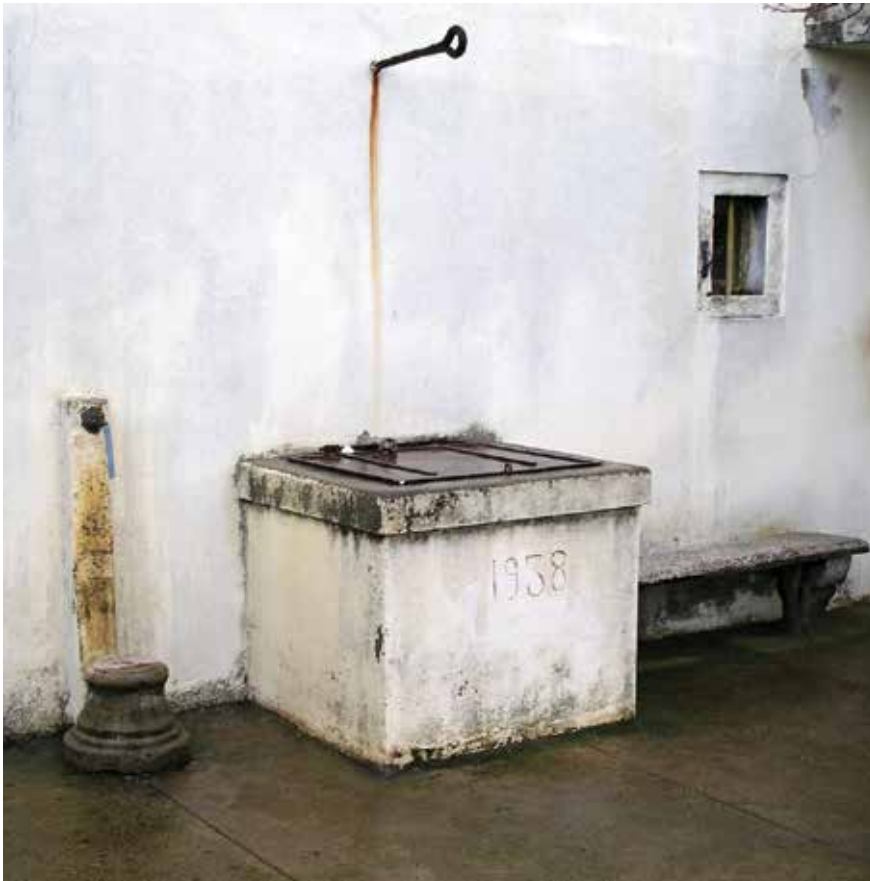
Gusterna u dvoru pok. Petra Učija Perovića

Izostanak većeg broja gusterna lako se može objasniti položajem Arbanasa i jakim podzemnim vodama koje su omogućile nastanak velikog broja bunara. Stoga se tek na povišenom dijelu sela, na kojem je voda bila toliko duboko da bunare nije imalo smisla kopati, može susresti upotreba gusterna. Vjerojatno je to razlog iz kojeg je crkva, koja se nalazila na najuzvišenijoj točki, imala gusteru, a ne bunar.