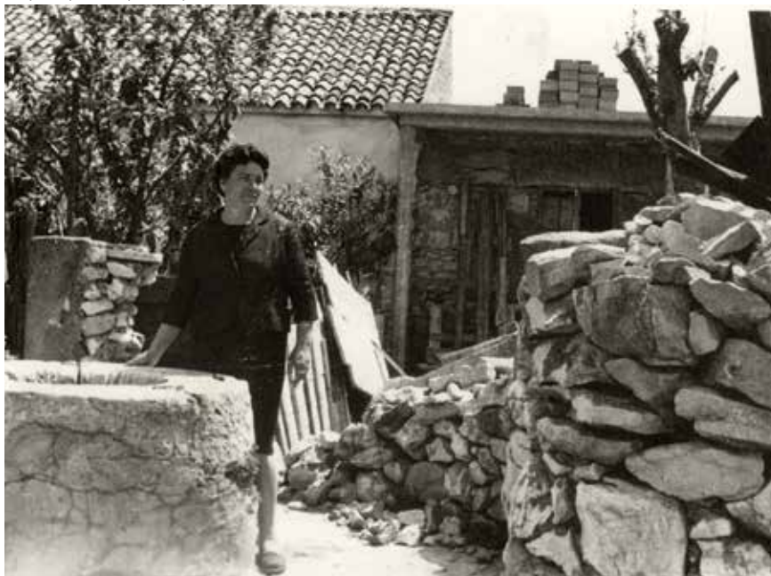
Bunar u dvorištu Kotlara

Svi koji su probali bunarsku vodu znaju koliko je osvježavajuća i drukčija po svemu od vode iz vodovoda. Govorilo se da ona izvire iz srca zemlje. Često je bunar služio i kao hladnjak u koji su se spuštale mnoge namirnice da bi se u hladnoj vodi sačuvale od kvarenja. Posebno se pamte u bunaru ohlađene lubenice (arb. çarçini ) koje su za ljetnih vrelina bile najbolje osvježene.