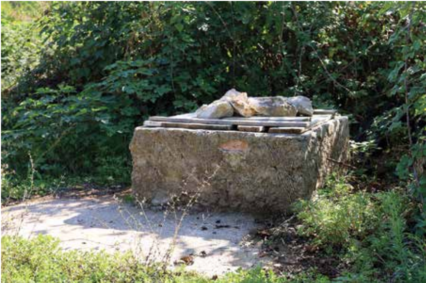
Bunar u vrtu Barolomea Bore Bajla