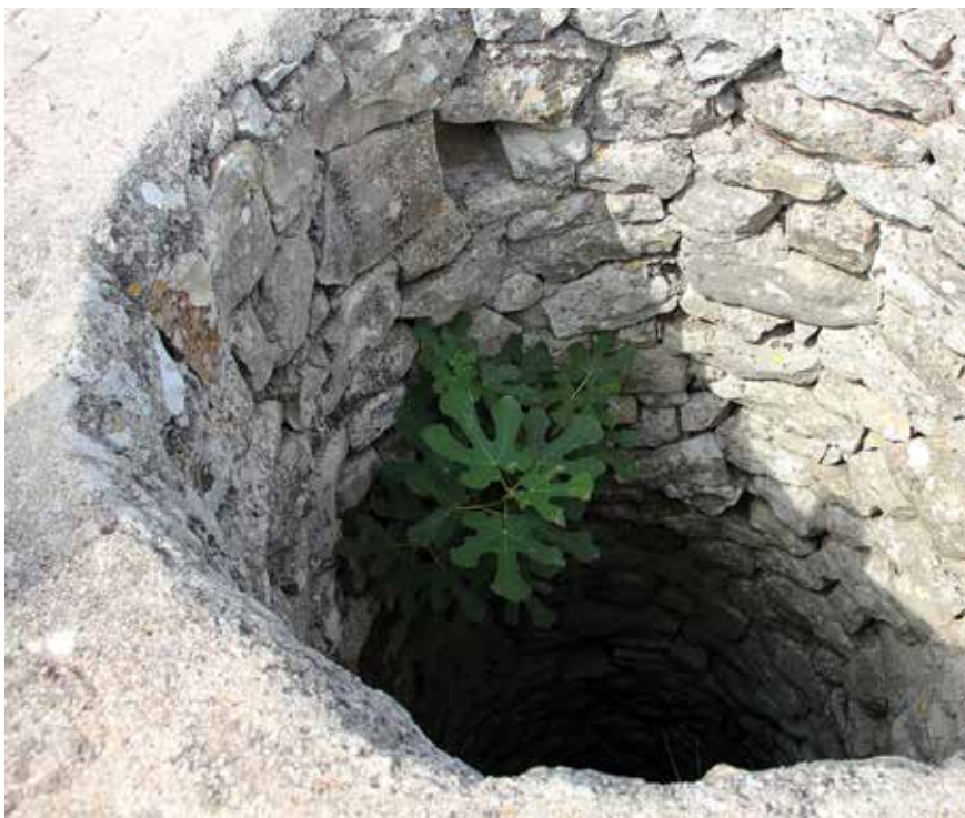
U zapuštenom bunaru i smokva raste

Danas su, zbog tih opasnosti, zbog njihove nevažnosti, smetnje, zauzimanja prostora kraj kuće ili tko zna zbog kojeg razloga, bunari izgnani iz naših dvorišta i naših života. Bilo je i tragičnijih završetaka. Neki „mudri“ sumješteni u bunar su spajali kanalizaciju, pa su tako čistu izvorsku vodu, koje već danas u svijetu nedostaje i za koju se kaže da će u budućnosti biti jedan od značajnijih izvora bogatstva, oni namjerno zagadili fekalijama. No to im se ubrzo osvetilo. Nedavno, za vrijeme Domovinskog rata, kad je grad bio odsječen od zaleđa, a time i od izvora vode, i kad su se upotrebljavali svi mogući načini da se do nje dođe, mnogi su arbanaški bunari ponovno, valjda posljednji put, poslužili svrsi i u najkritičnijem trenutku pomogli svojim vlasnicima. Tada su oni koji su na njih spojili crne jame zažalili zbog toga što su napravili.