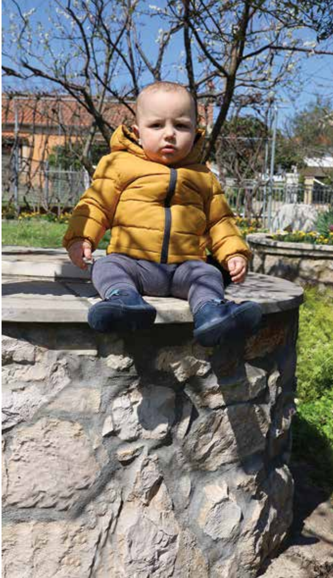
Arbanaška budućnost i prošlost zajedno

Čuvanjem starih bunara želi se sačuvati dio spomeničke baštine, a ova izložba samo je mali podsjetnik na to, pa možda se nešto i izrodi!?! Zasad, ono što je preostalo od bunara uz pomoć starih fotografija možemo sačuvati barem u sjećanju.