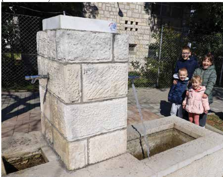
Obnovljena javna špina (slavina) kod stare Tvornice duhana

Tada je u mjestu postavljeno šest javnih špina (slavina): kod stare Tvornice duhana, kod crkve Gospe Loretske, kod Jovića (Marežini), kod stare Muške osnovne škole (Perovići - Dancini), na raskrižju Punte Bajlo i nad uvalom Podbrig na Karmi. Međutim, novopostavljene cijevi prvog vodovoda bile su malog profila, pa se ubrzo pokazalo da ne zadovoljavaju potrebe ondašnjih stanovnika.