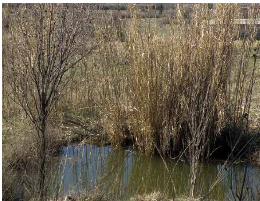
Lokača (arb. Lokâça )

ona kod Marenjole ( Lokâça nëj Marenjoles ). Osim njih, koliko je poznato, jedan se predio na području Šumpinova, istočno od današnje osnovne škole, naziva Lokače upravo zato što se i ondje skupljala voda.