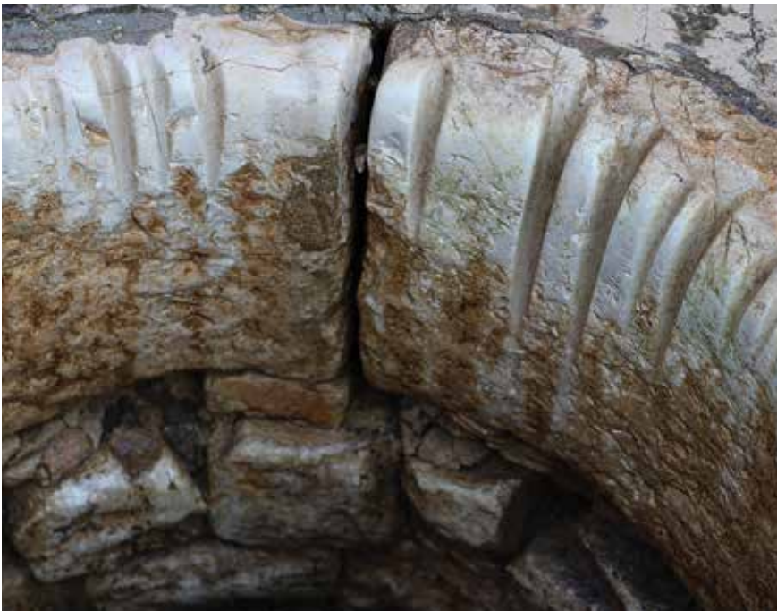
Friži na kruni jednog od mnogih starih bunara

U određenom broju bunara, posebno u predjelima bližima moru, voda je bila boćata , odnosno bila je pomiješana s morskom vodom. Kao takva nije se upotrebljavala za piće, nego je služila za zalijevanje vrtova. Boćati su bili bunari kod Grdovića i Petrića u Gaženici, zatim bunar kod „stola“, odnosno kod podvožnjaka (arb. Funtôna në Vo ), i još neki, posebno na Puntii Bajlo na kojoj je razina zemlje bliža razini mora.