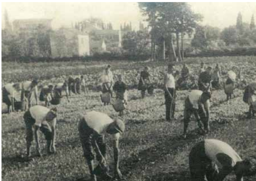
Vrijedne ruke arbanaških žena i muškaraca u Grapi

Među arbanaške bunare treba ubrojiti i onaj na plodnom polju smještenom na sjeverozapadnom kraju mjesta, području koje Arbanasi nazivaju Grapa , a koje je još od vremena Austro-Ugarske Monarhije imalo funkciju državnog rasadnika i poljoprivrednog učilišta na razini cijele Dalmacije. Bunar ondje smješten bio je po svemu sudeći većih kapaciteta. Stari ljudi sjećaju se da je neposredno pored njega bio izgrađen rezervoar za vodu uzdignut nekoliko metara iznad zemlje, u koji se iz bunara pumpama voda podizala kako bi se s povišene točke mogla slijevati po polju prilikom navodnjavanja.