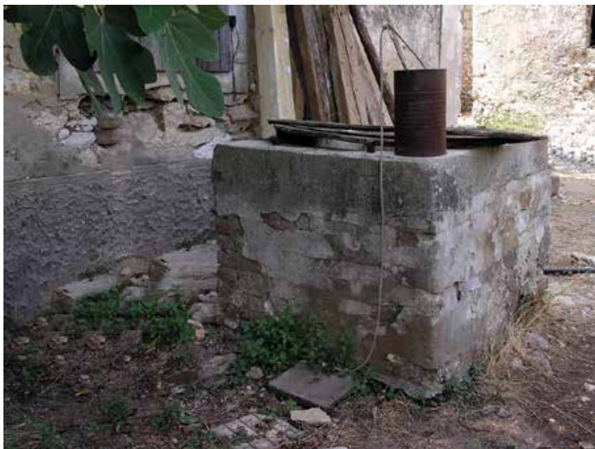
Stari bunar u starom dvorištu Mazija (Ogini)