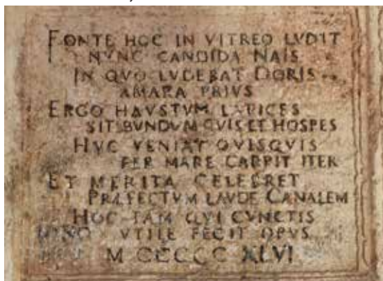
Natpis iz 1546. godine u unutrašnjosti Fontane

Osim toga nepoznatog latinskog pjesnika, i oni mnogo poznatiji nadahnjivali su se tim izvorom. Još desetak godina prije naš prvi romanopisac Petar Zoranić u svojim je Planinama o Fontani ispričao cijelu ljubavnu priču ukorijenjenu u antičkoj i slavenskoj mitologiji. Iz slavenske mitologije poslužio se likom Paprata, sina bogova Dunava i Save, kao mladićem koji se zaljubio u Stanu, kćer antičkog boga mora Neptuna i slavenske božice Žarke. Ta ljubav simbolizira spoj panonske i primorske Hrvatske. Njih je u ljubavi omeo latinski bog Apolon ubivši ih oboje. To simbolizira stoljetni sukob slavenstva i romanstva na našoj obali.