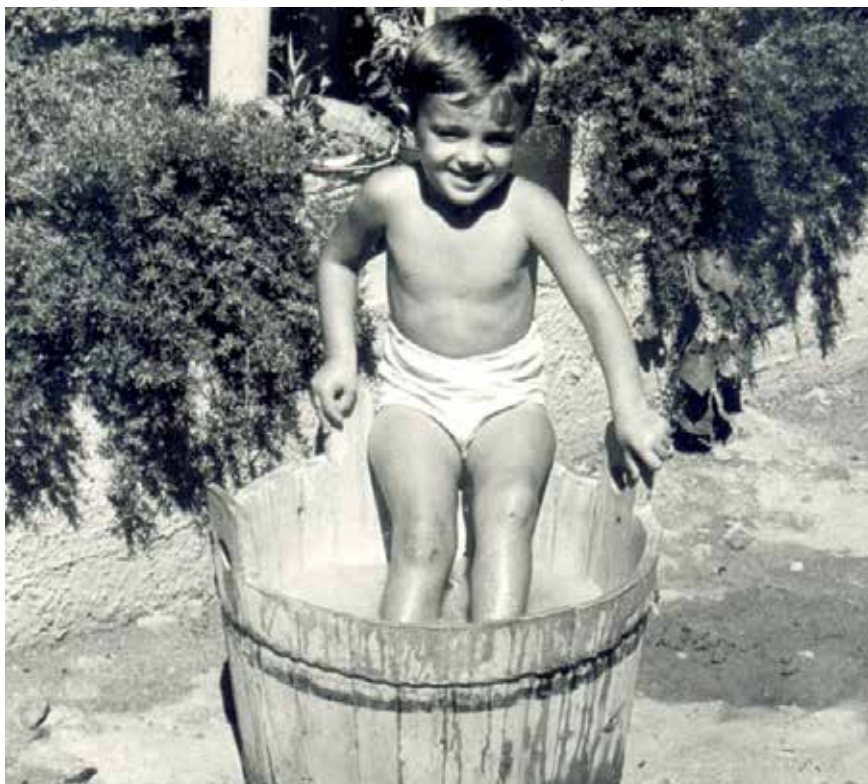
Nekadašnja kada za kupanje

Danas od svega toga nema ničega. Kada ste žedni, postupak je vrlo jednostavan – uzmete čašu, otvorite bocu vode ili odvrnete slavinu i eto, ništa lakše. Kad želite skinuti prljavštinu sa sebe, napravite sličan postupak. Ali nekada se za to trebalo malo više pomučiti, u doba kada nije bilo vodovoda ... Rekli bismo: u ono doba bunara, studenaca ili gusterna. E, upravo na ta „vremena bunara“ želi nas podsjetiti ova izložba.