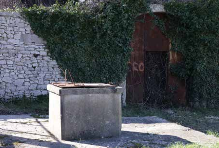
Bunar u Babindubu (arb. në Dubin ) kod Dukine kuće

Prilikom zalijevanja vodu se crpilo gdje se god moglo. Osim već spomenutih bunara i izvora, po vodu bi se išlo do Babinduba u Dukine kuće na tamošnji bunar, zatim na Ploče na spomenuti bunar Čatrnja te u Crno u kojem je bunar Ljoljac također sačuvan sve do danas i na kojem su se Arbanasi također koristili vodom za potrebe zalijevanja polja.