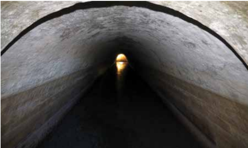
Unutrašnjost vodovodnog objekta Botina, tzv. akvidot