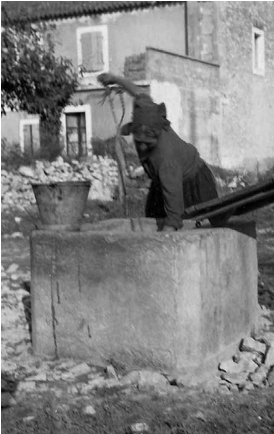
Snažne ženske ruke grabe vodu iz bunara u vrtu Krstića (Vengini).