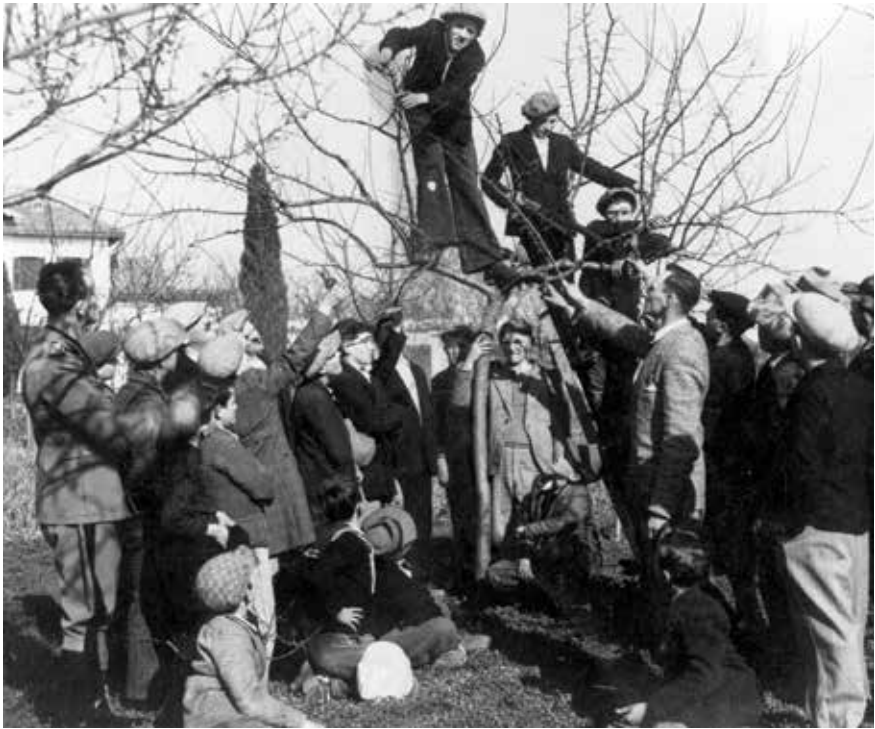
Škola obrezivanja stabala u jednom od gradskih vrtova