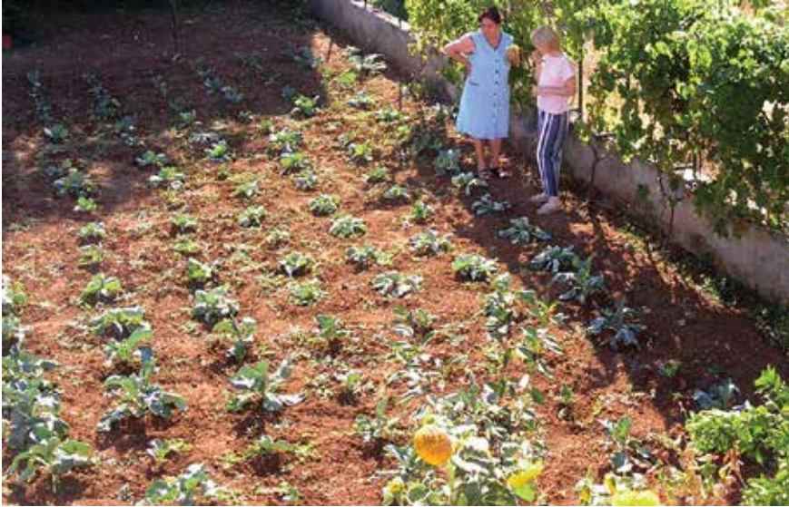
Jedan od malih arbanaških vrtova

Usprkos svemu, ipak je činjenica da bunari koji su nekada bili izvor vode i života više ne služe ničemu jer više nema ni stoke koje se na njima napajala, a arbanaško poljodjelstvo svelo se na male vrtove u blizini kuća.