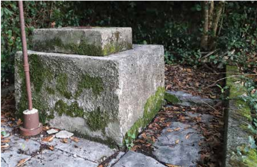
Bunar u dvorištu Jaka Dešpalja

Međutim, ta mreža bunara čini dio naše materijalne kulturne baštine jer i oni, pored ostaloga, pokazuju na kojoj je razini nekad bila kultura svakodnevnog života u ovom mjestu.