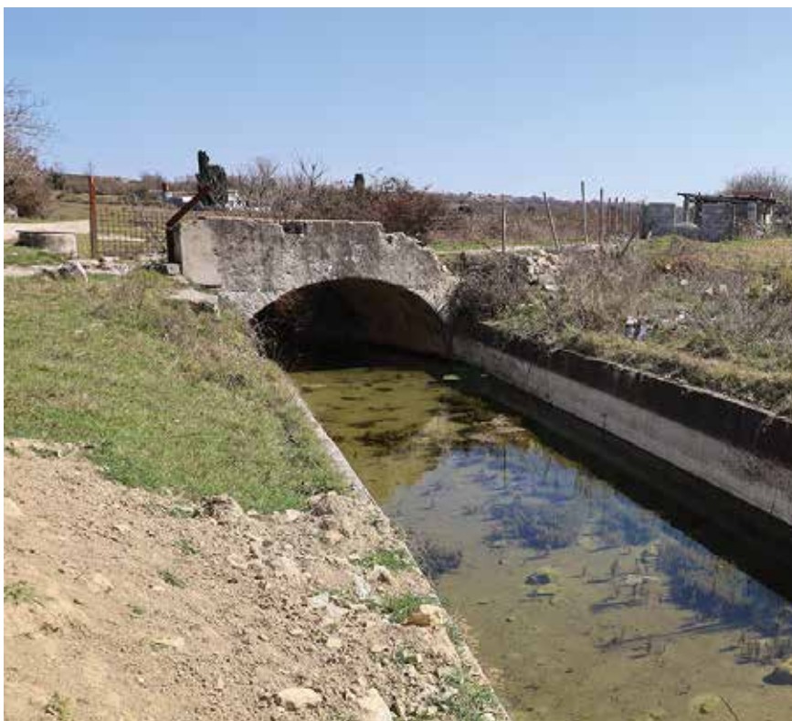
Stari most preko potoka Ričina

Na području koje se prostiralo negdje od gradskih zidina pa sve do Rečina, još prije doseljenja Arbanasa, protezali su se gradski vrtovi ( zardini Jadrenses ) u kojima se uzgajalo voće i povrće za opskrbu grada. Na tom području moralo je biti mnogo izvora vode, odnosno bunara, koje su Arbanasi po dolasku zatekli i njima se koristili. Danas nije moguće utvrditi koji su to, no bez dvojbe je dio arbanaških bunara starijeg datuma. Naravno, Arbanasi su sagradili čitav niz novih bunara, među kojima je najznačajniji po veličini i po bogatstvu vodom seoski bunar, zvan Veliki bunar, načinjen 1907. godine pokraj današnjega autobusnog kolodvora.