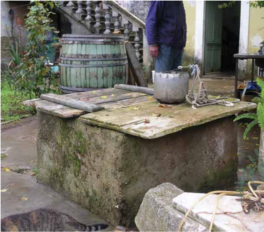
I danas se grabi voda starim sićem iz bunara u dvoru Pere Panina Stipčevića.