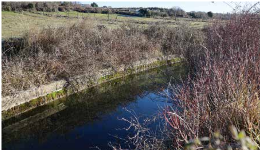
Ričina (Rečina), zvana jednostavno potok ili jaruga, prolazi kroz arbanaška polja...

No glavina vode koja je dolazila od Ploča spuštala se kao potok okomito prema moru, pod nazivom Ričine (Rečine), Potok ili Jaruga. On je i danas živ iako u ljetnim mjesecima presuši. Od predjela robne kuće Supernove spušta se prema gradskom groblju, a onda utječe u more.