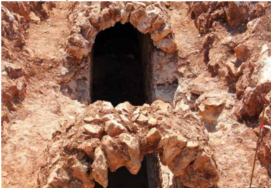
Uz današnju cestu Franka Lisice vidljivi su dobro očuvani ostaci rimskog vodovoda

Na području Arbanasa nalaze se ostatci monumentalnoga rimskog vodovoda kojim su Rimljani dovodili pitku vodu iz vrela Biba blizu Vrane do antičkog Jadera. Oni su dobro sačuvani jedino još uz današnju cestu Franka Lisice premda su u novije vrijeme i ondje dosta oštećeni novogradnjama. Odatle se vodovod spuštao do današnje bolnice pa onda zaokretao prema gradu.