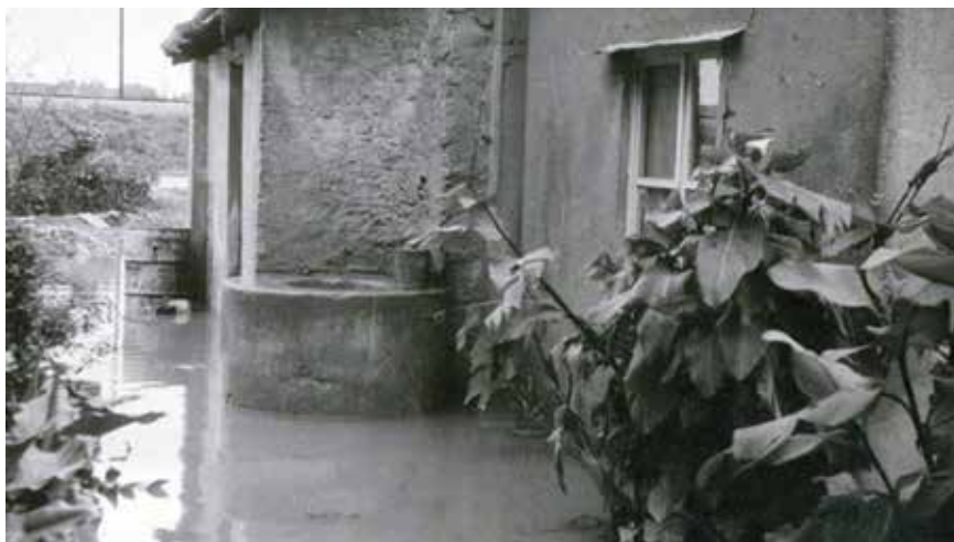
Bunar iza kuće Krste Stipčevića (Markišimini) u vrijeme poplave 1967. godine