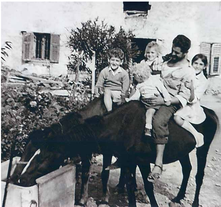
I najmlađi su ponekad u društvu starijih vodili konje na napajanje.

Osim za zalijevanje, svakako je važna funkcija bunara bila napajanje stoke. Već je rečeno da je kod Fontane za to bilo postavljeno kameno korito ( vaška ). Također, i kod Velikog bunara bilo je načinjeno kameno korito dužine četiri metra za stoku, koje se punilo vodom uz pomoć ručne pumpe čiji se ostatci još vide.