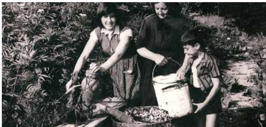
Tri generacije uz ručnu pumpu za vodu