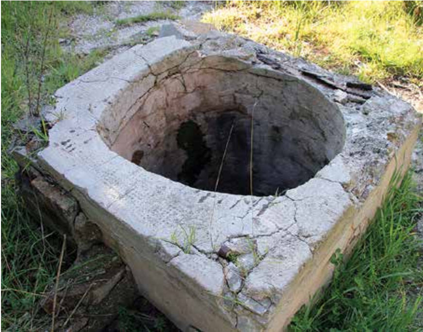
Ostatci bunara u dvorištu kuće Vukića (Butineli)