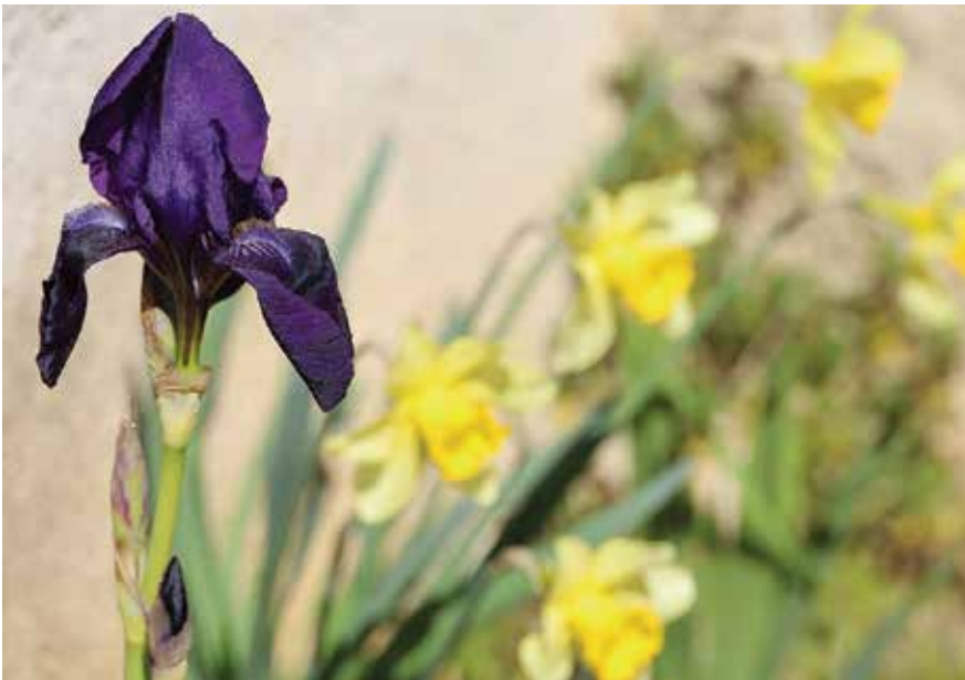
Oko Velikog bunara rasli su ovi ljubičasti cvjetovi koje nazivaju pipat .